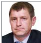
АЛЕКСАНДР КЛИМЕНТЬЕВ Заместитель министра природных ресурсов Забайкальского края, генеральный директор ВОСТОЧНО-СИБИРСКАЯ НЕФТЕГАЗОХИМИЧЕСКАЯ КОМПАНИЯ